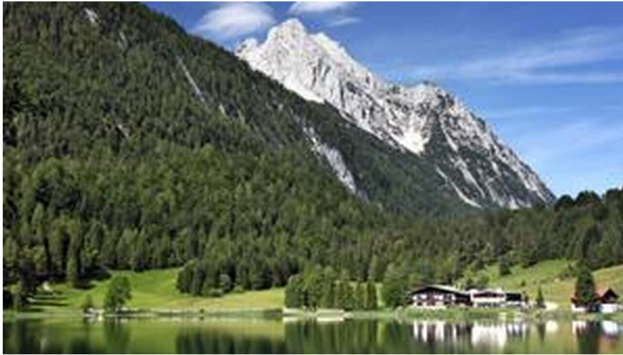
Hotel Lautersee mit Wetterstein