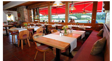
06_Hotel Lautersee_02072015_Pohmann (Klein)