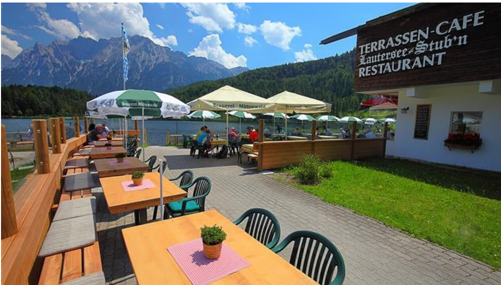
35_Hotel Lautersee_02072015_Pohmann (Klein)