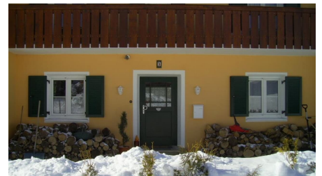
Haus Winter Front1