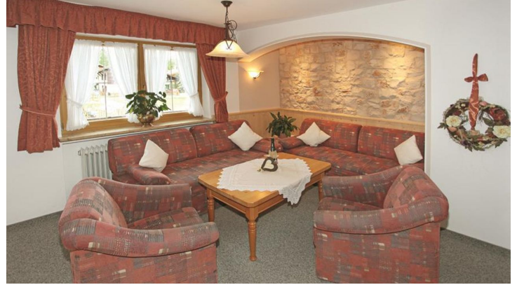
Sitzecke - Sofa