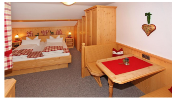
Karwendel Schlafen 3