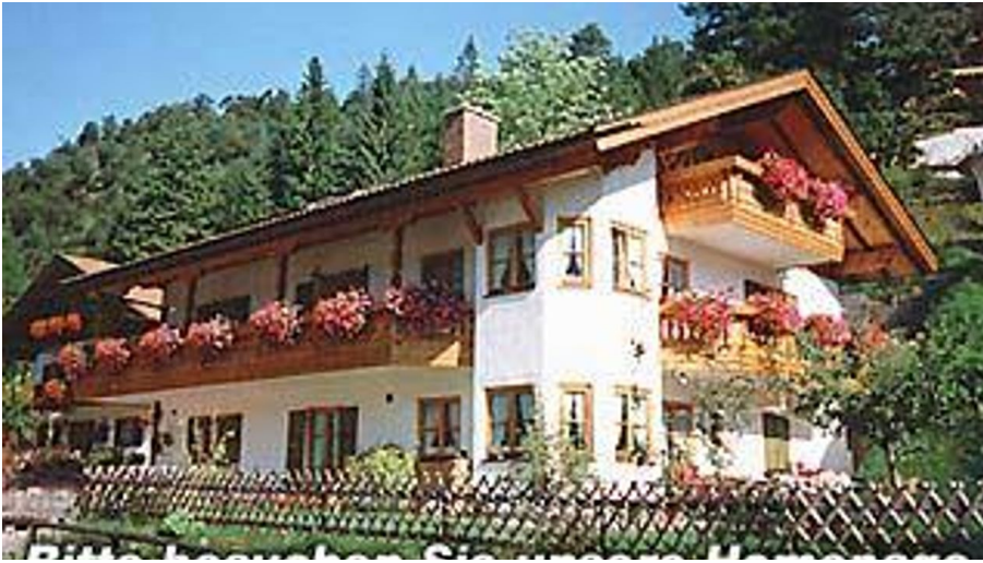
Haus Sommer