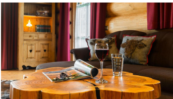
Wohnraum - © Susanne u. Ulrich Holzer, U.Holzer