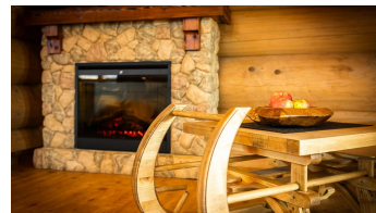
Schlitten im Wohnraum