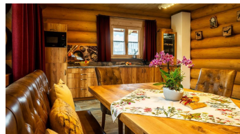
Tisch in der Küche