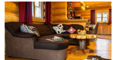
Sofa im Wohnraum