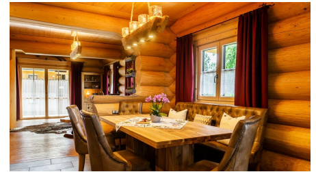
Küche mit Tisch