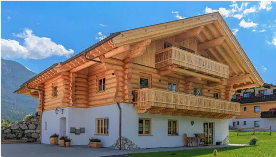
Alpenchalet St. Ulrich - Hauszufahrt