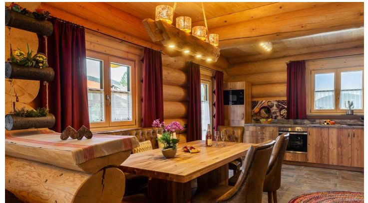
Tisch in der Küche - © Susanne u. Ulrich Holzer, U.Holzer