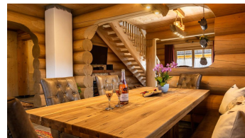
Herzlich willkommen!