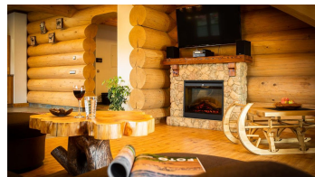
Kamin im Wohnraum