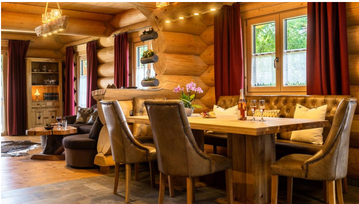
Küche mit Wohnraum