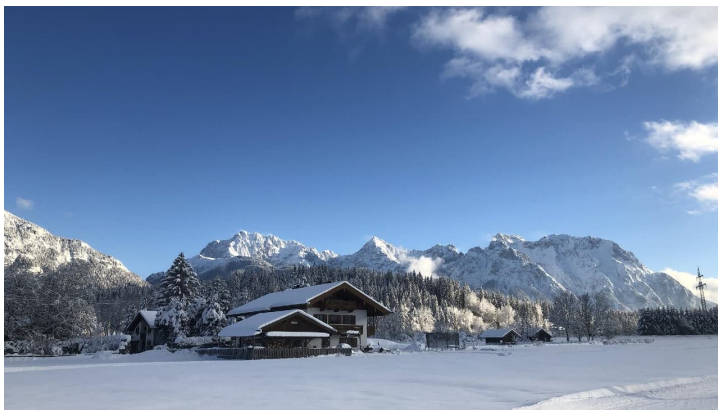
Blick Richtung Karwendel