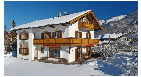
Haus Winter 2