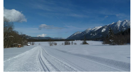
Langlaufen am Barmsee