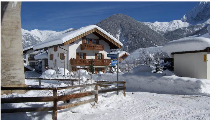
Winter 2009 034