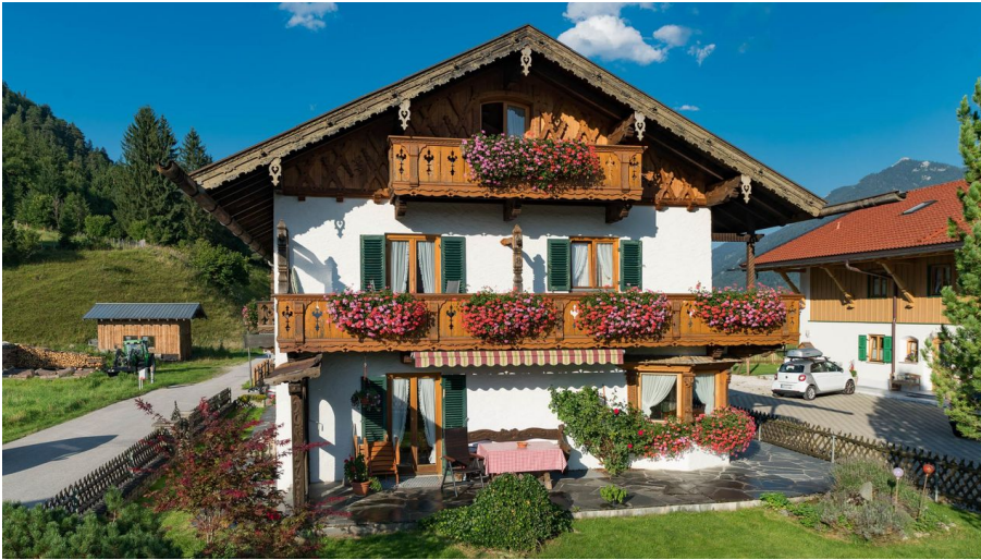
Gästehaus Ulrich Neuner "Baumann"