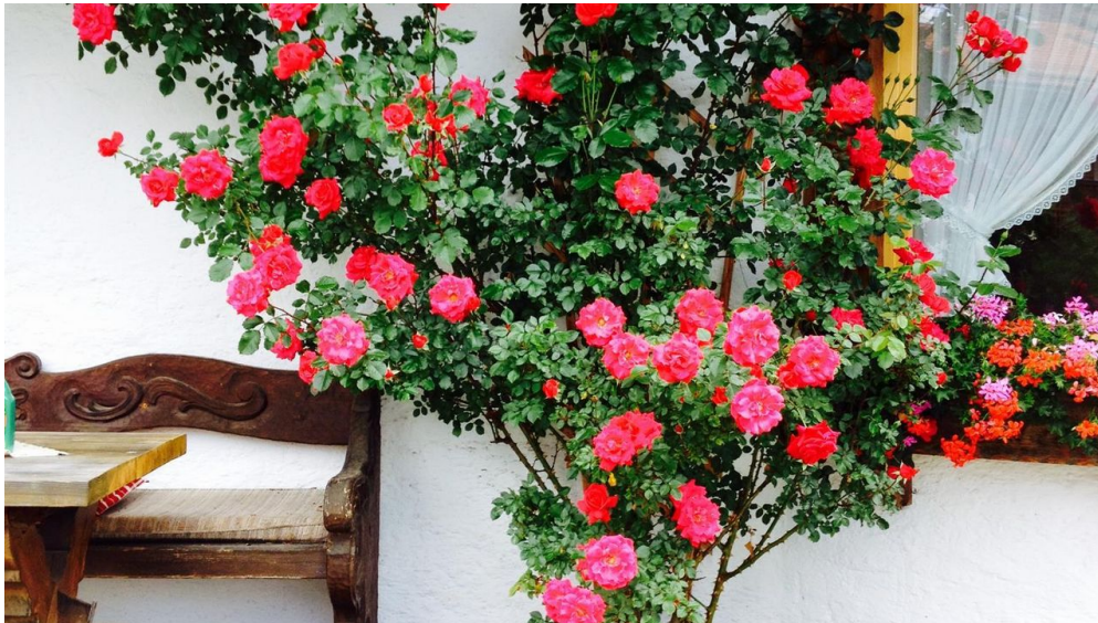
"Gästehaus Ulrich Neuner"