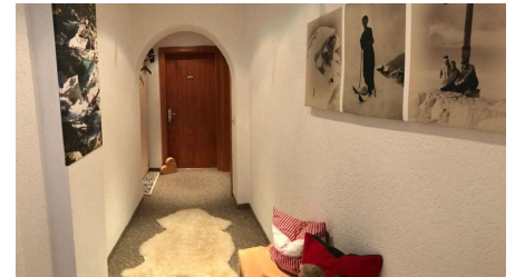
"Gästehaus Ulrich Neuner"