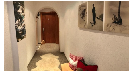
"Gästehaus Ulrich Neuner" - © Sebastian Baumann