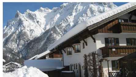
Haus im Winter