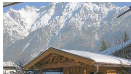
Aussicht vom Balkon