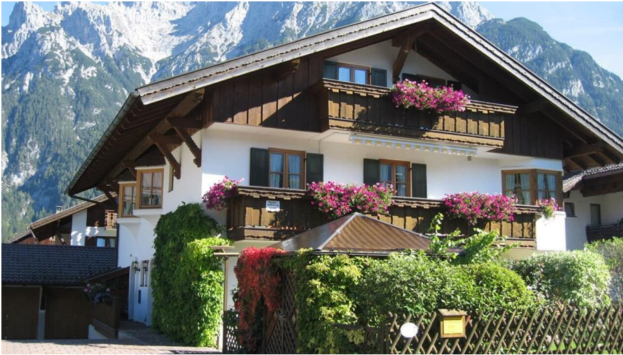
Haus im Sommer