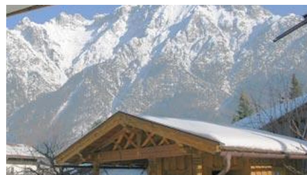
Aussicht vom Balkon