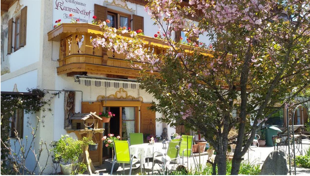
Hausansicht 2