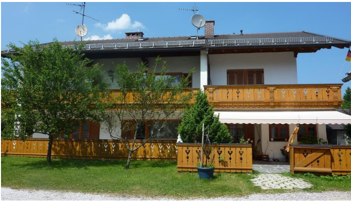
Fewo. Sonnenschein