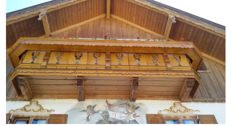
Hausansicht 3