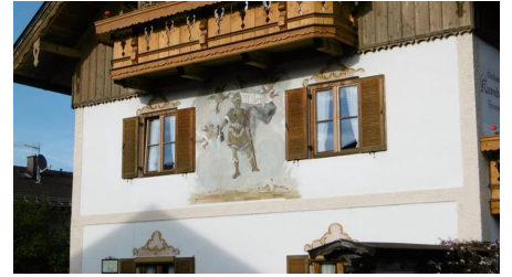
Hausansicht 3 verkleinert