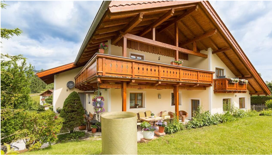
Rückansicht mit Garten