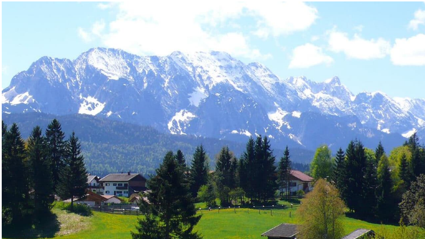
FW Christina: Aussicht