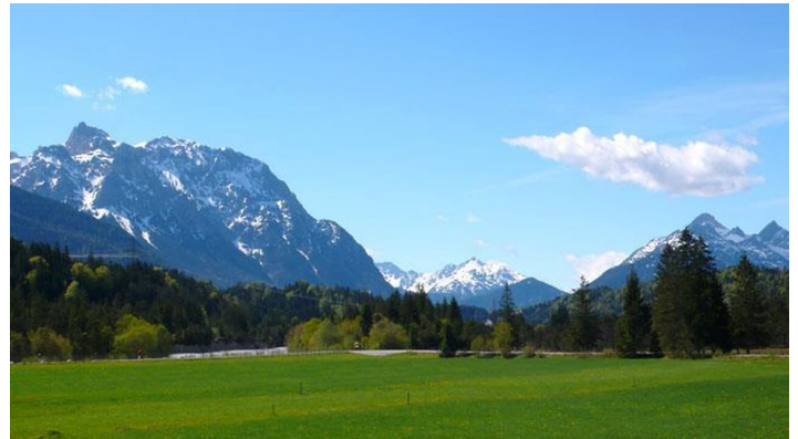
Aussicht über freie Wiesen zum Karwendel