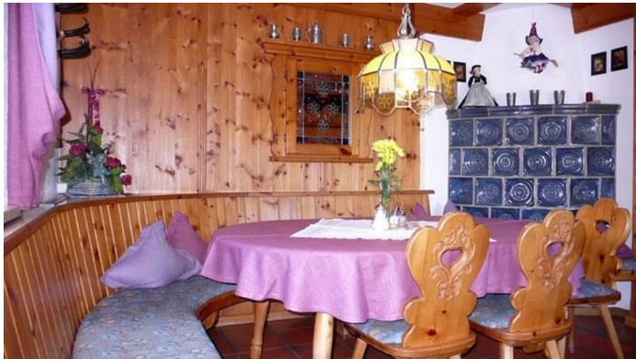
Gemütlicher Frühstücksraum mit Kachelofen