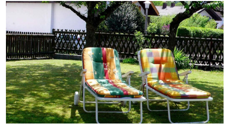
Liegewiese in Ihrem Garten