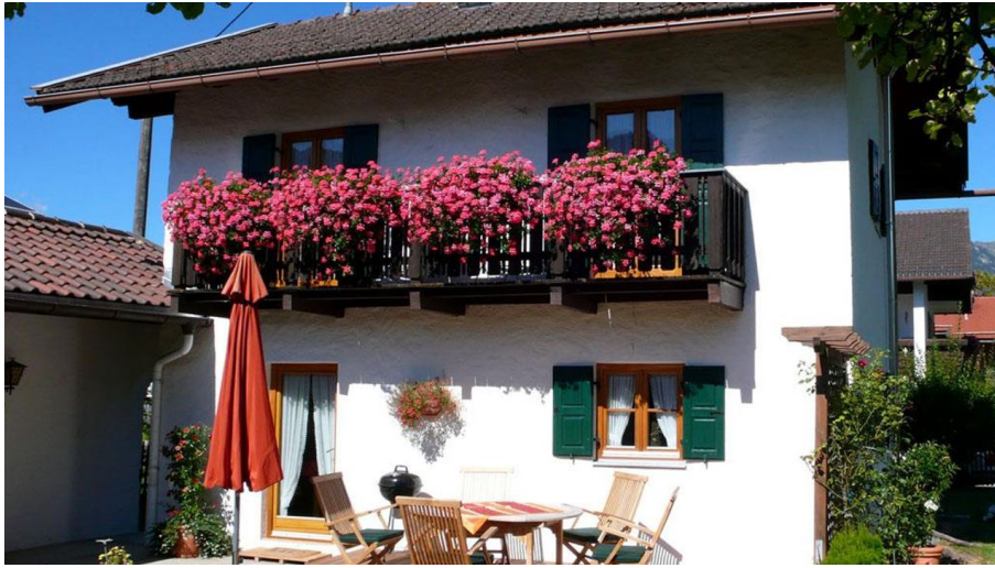
Haus Endres zum Alleinbewohnen