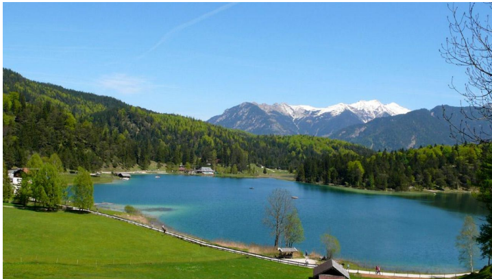
Lautersee: Wandern, Einkehren .....