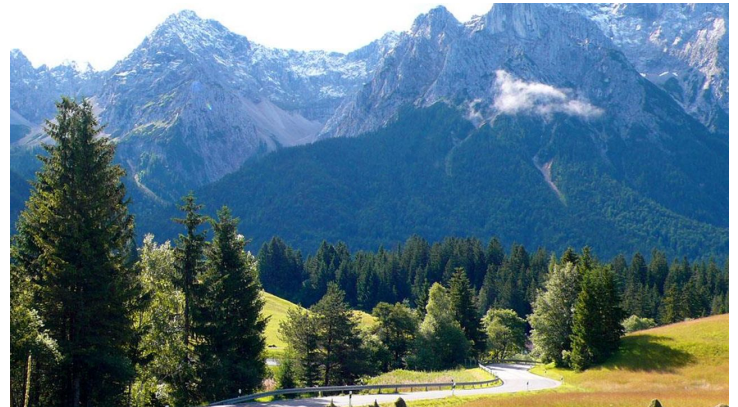
Karwendel mit Buckelwiesen und Heumandln