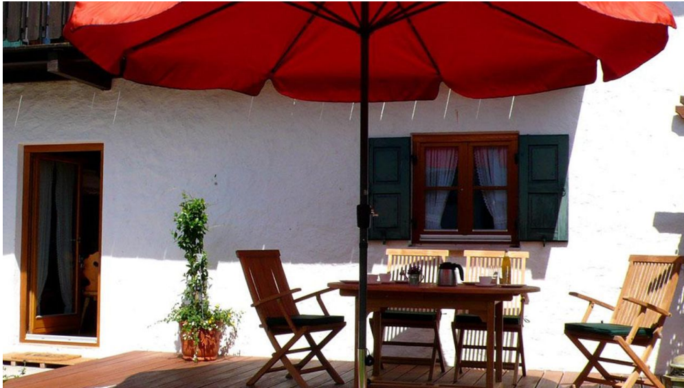
Ihre große Sonnenterrasse