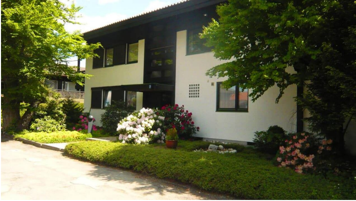
Hauseingang im Frühling