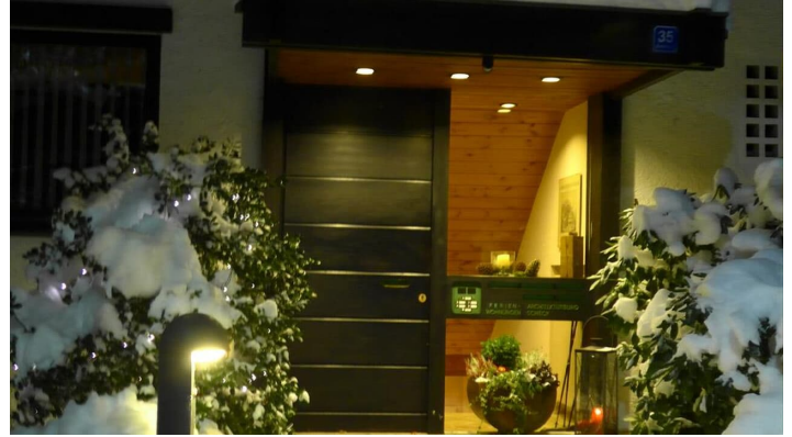
Hauseingang im Winter