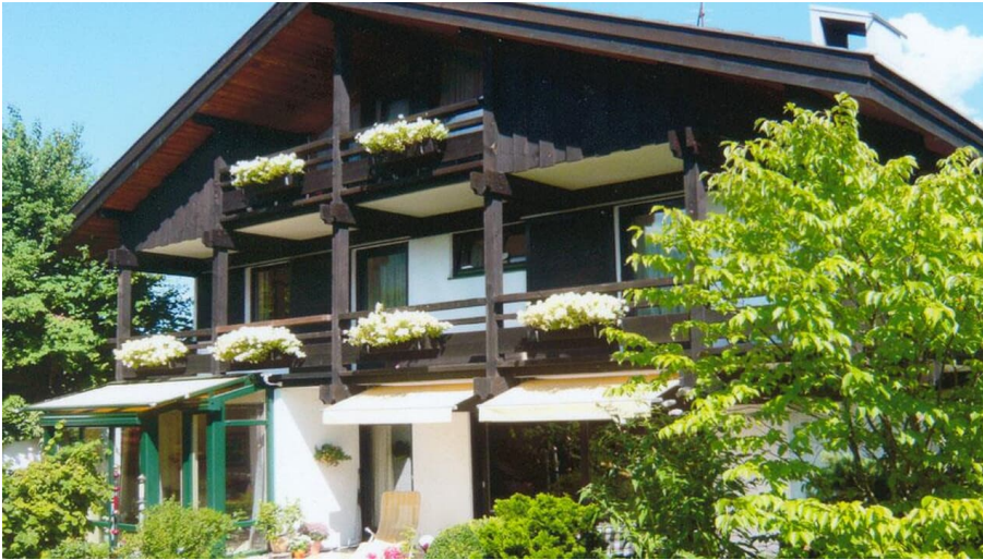
Herzlich Willkommen bei Familie Scheck