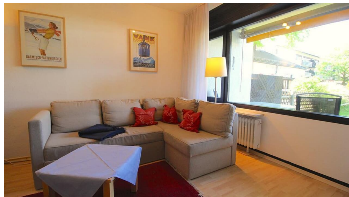
SCHLOSSGARTEN Wohnzimmer