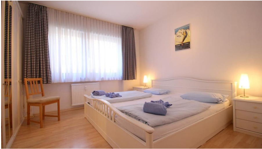
SCHLOSSGARTEN Schlafzimmer