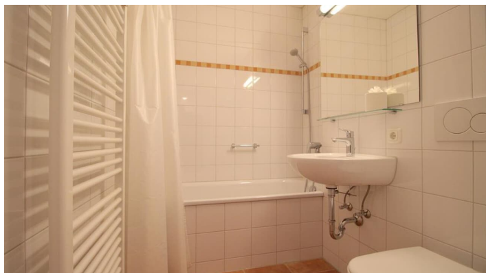
SCHLOSSGARTEN Bad