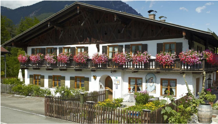
Das Haus Huis'n