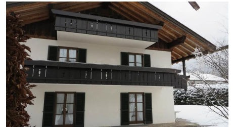
Die Wohnung liegt im 1. Stock