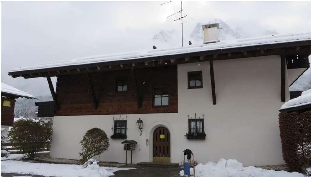
Das Haus am Kirschgarten