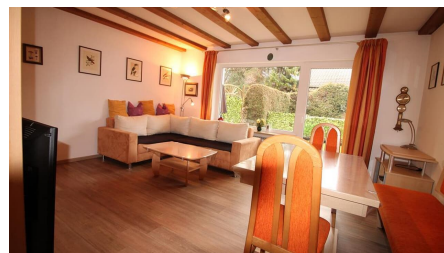
Wohnzimmer u. Essbereich