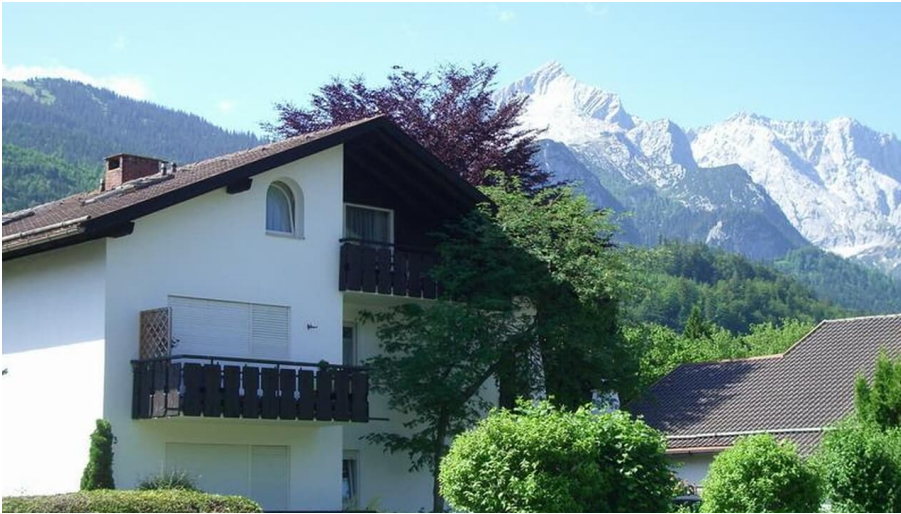
Haus und Blick zum Zugspitzmassiv