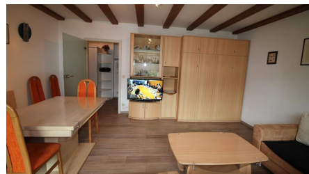
Wohnzimmer und Essbereich