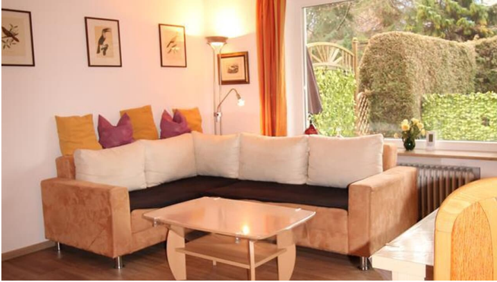
Sitzgruppe im Wohnzimmer