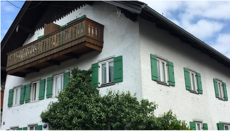
Ihre Gastgeber im Blauen Land