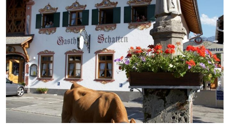
Antonius Brunnen vorm Hotel mit Butterhirschen