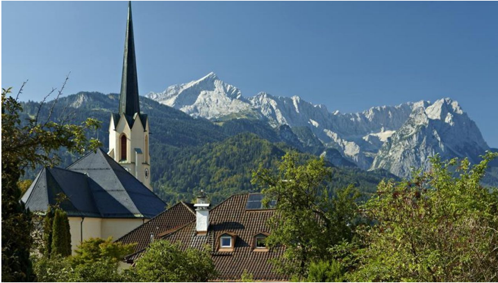
Einmaliger Blick vom Hotelzimmer m. Balkon