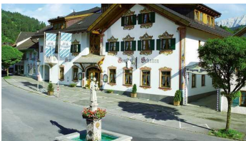
Akzent Hotel Gasthof Schatten