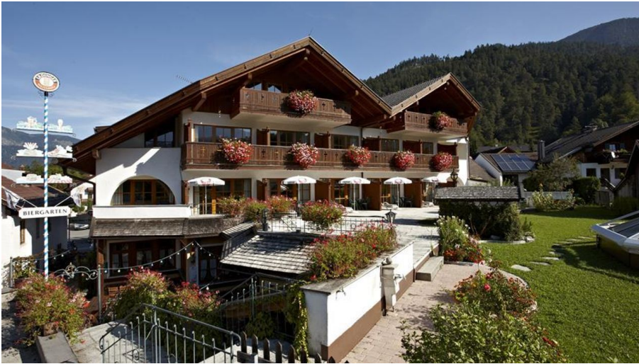
Akzent Hotel Schatten - Hotelgarten