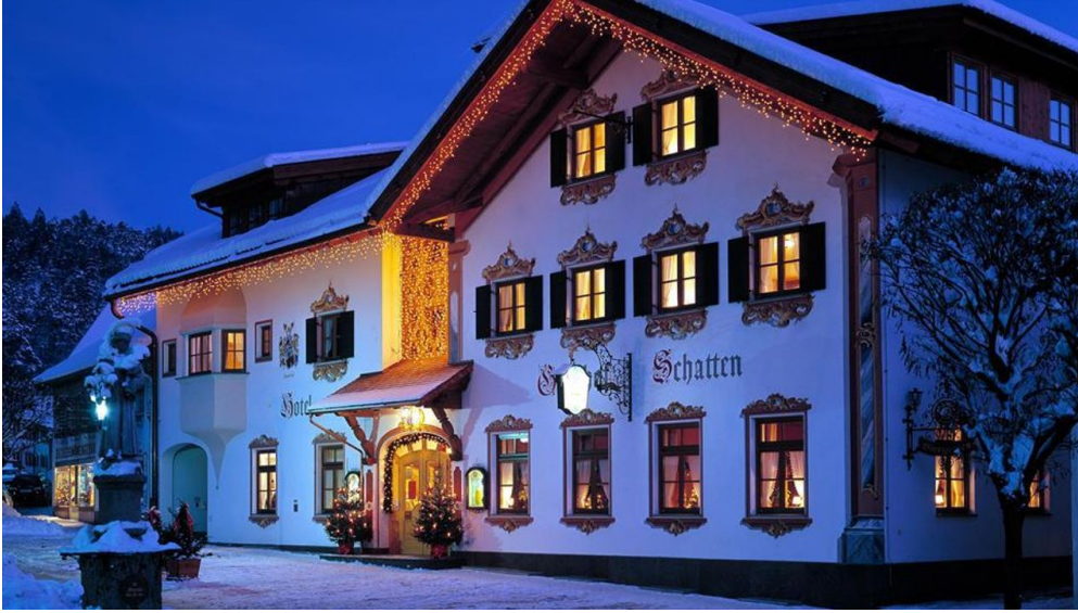
Akzent Hotel Gasthof Schatten - Winterbild