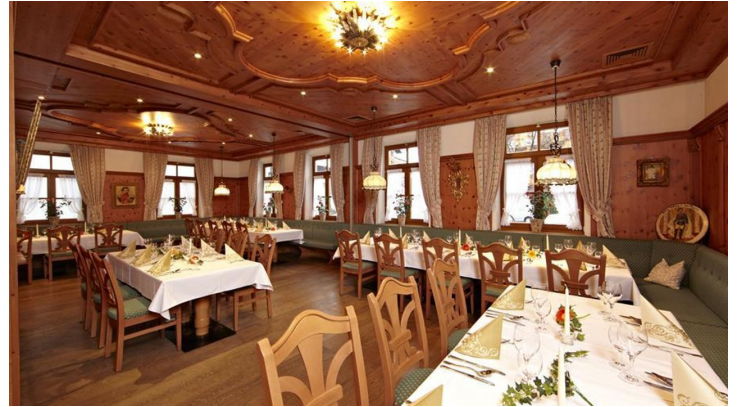
Akzent Hotel Schatten - Restaurant