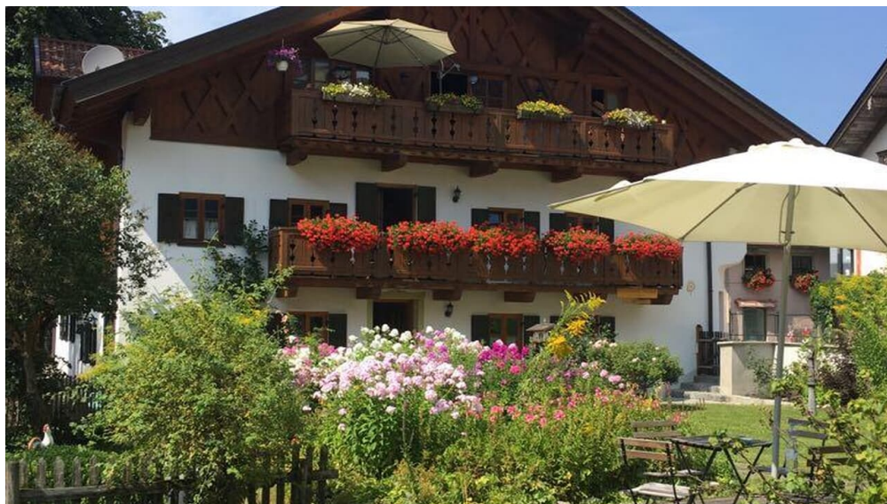
Sitzplatz im Garten