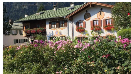
Blick zum Kofel