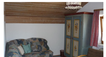
Schlafzimmer 1 mit Auszieh-Couch