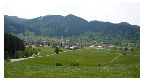
Wanderwege rund um U'gau