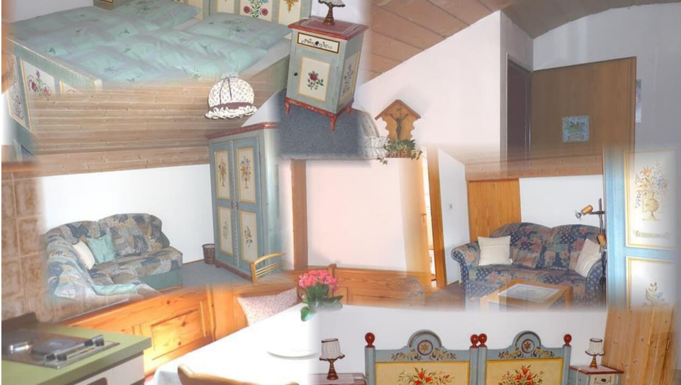
FeWo im Dachgeschoß