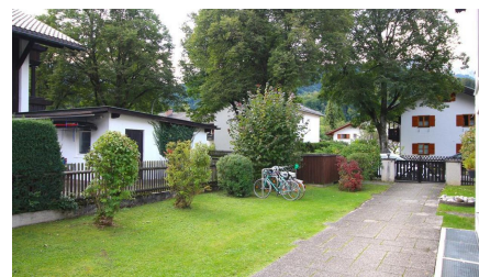
Zugang Haus 2