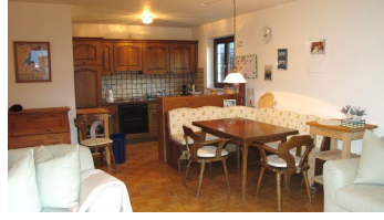
Wohnzimmer mit Essbereich