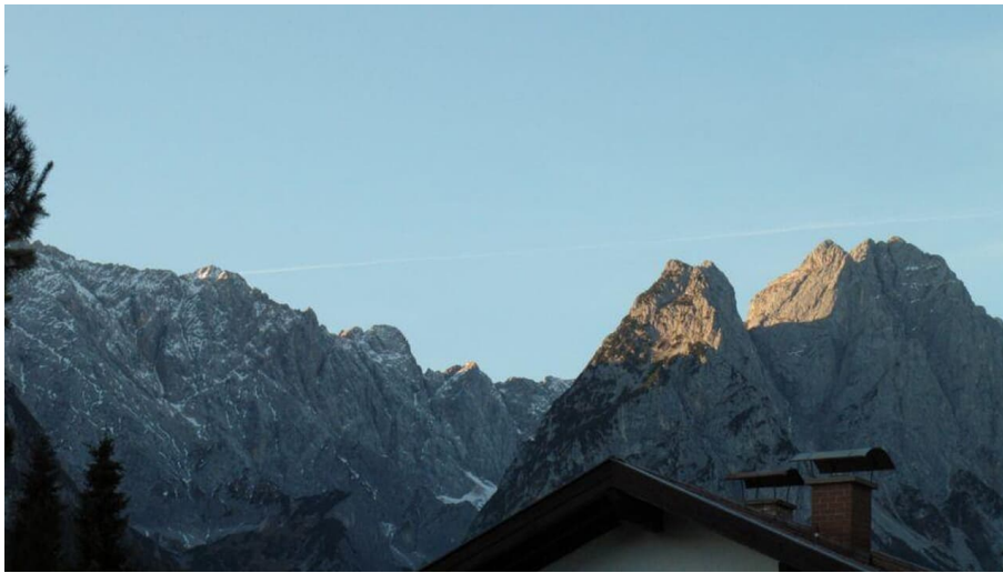
Blick von der Terrasse