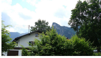
Aussicht von Terrasse