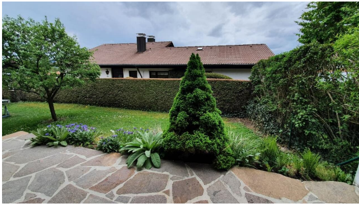
Terrasse und Garten Richtung Süden