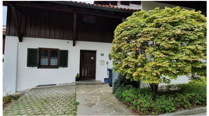
Eingang mit Parkplatz