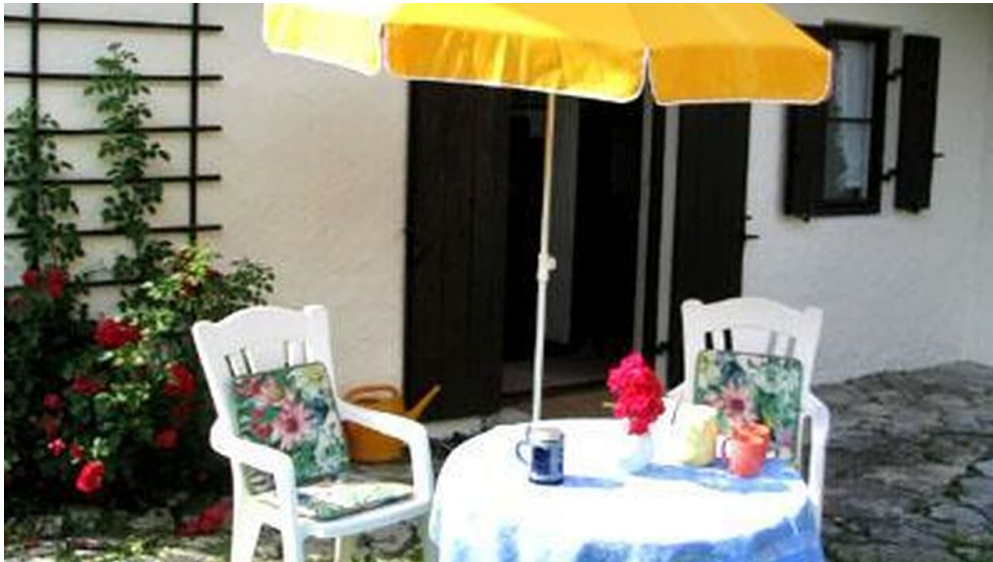
Südterrasse und großer Garten mit Liegewiese