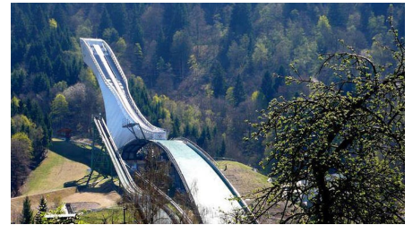
Blick vom Südkalkon zur Olympia Skisprungschanze