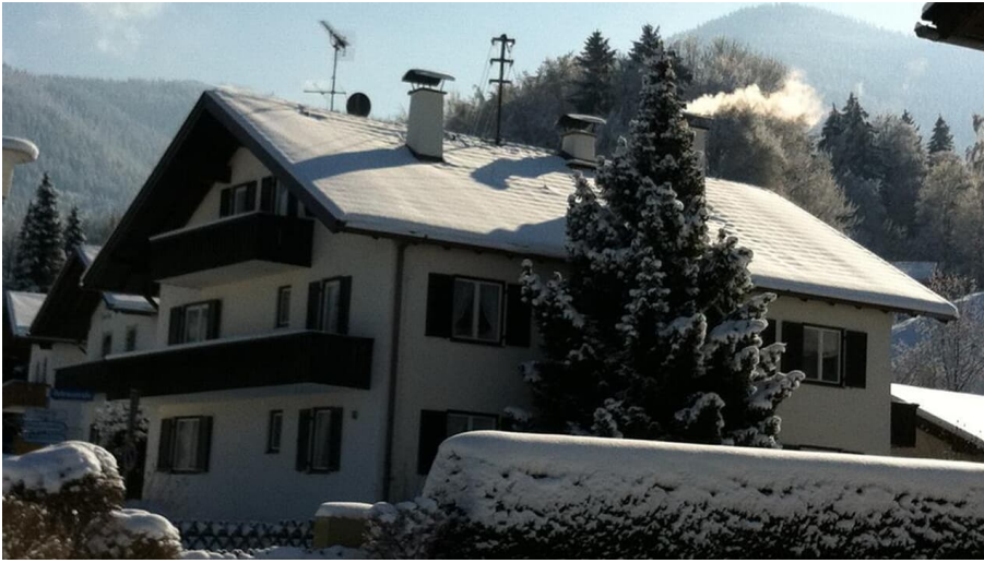
Ammertaler Ferienwohnungen im Winter