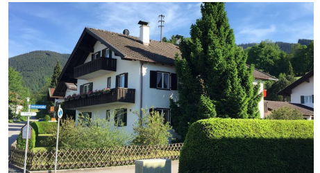
Ammertaler Ferienwohnungen