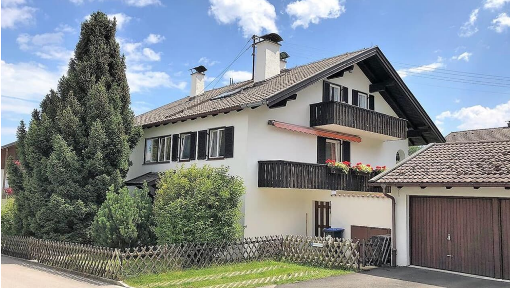
Haus Gehrenstraße