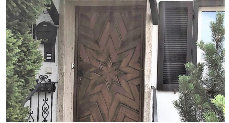
Haustür - © Ammertaler Ferienwohnungen