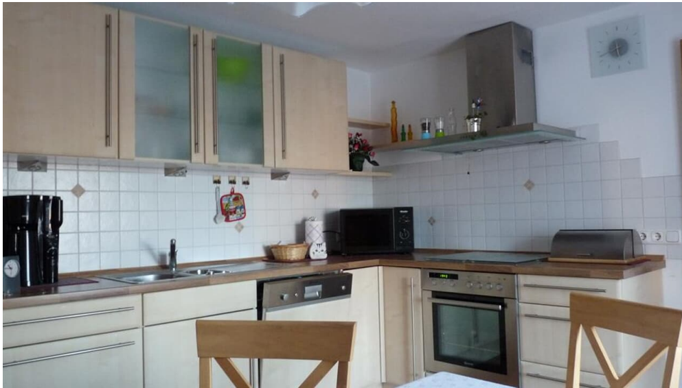
Küche mit Essecke