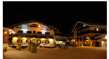
Weihnachten in der Fußgängerzone Garmisch