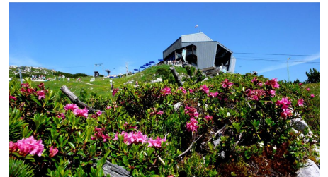
Alpenrosen am Osterfelderkopf