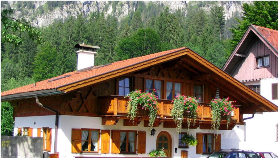
Herzlich Willkommen bei Familie Ostler!