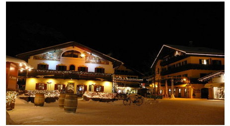
Weihnachten in der Fußgängerzone Garmisch