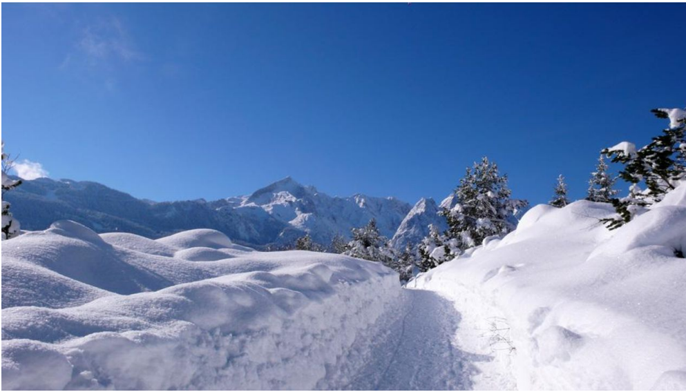
Kramerplateauweg beginnt in der Nähe