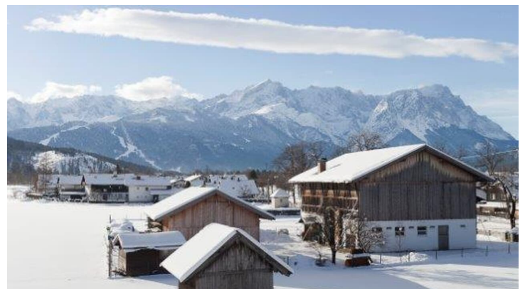
Panorama 1 Tag