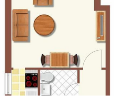
Grundriss-300 - © m.w.