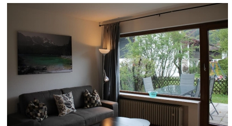
Schlafsofa mit Blick auf die Terrasse