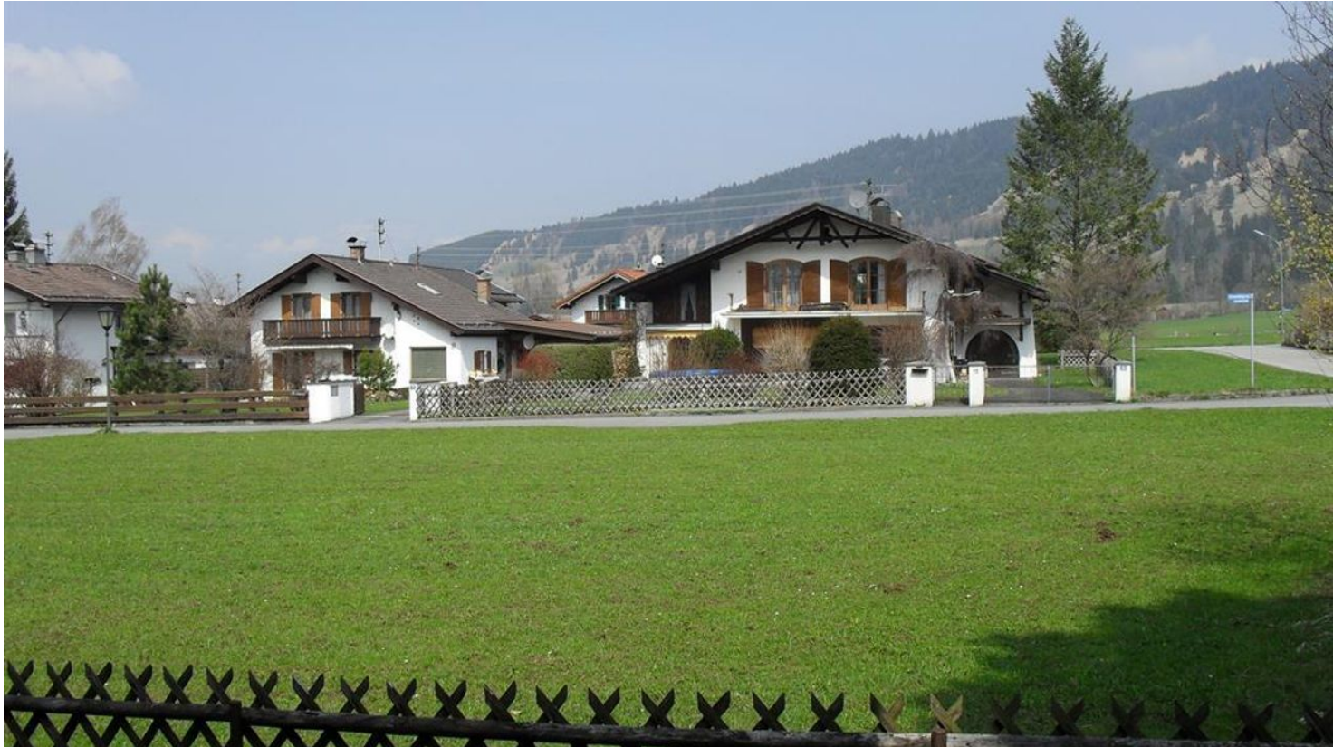
Blick vom Balkon - © privat