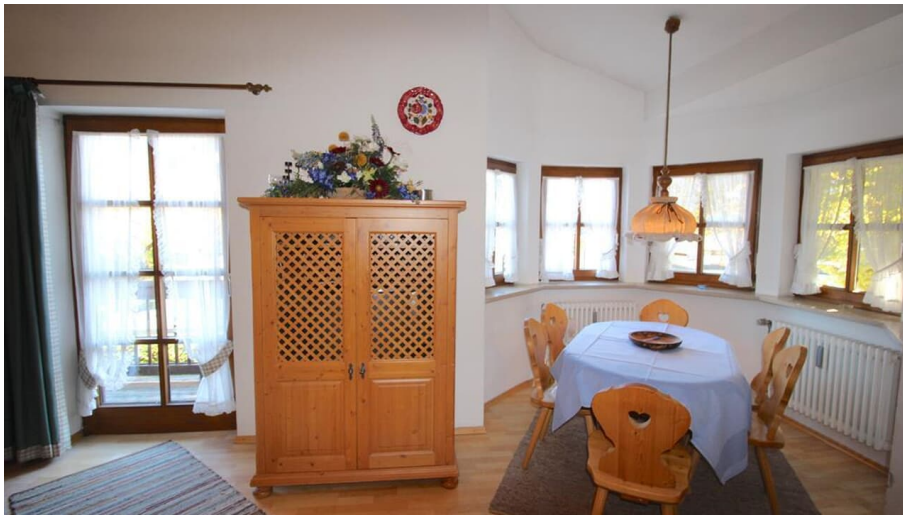
MARTIN Essbereich