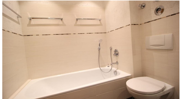
MARTIN Bad