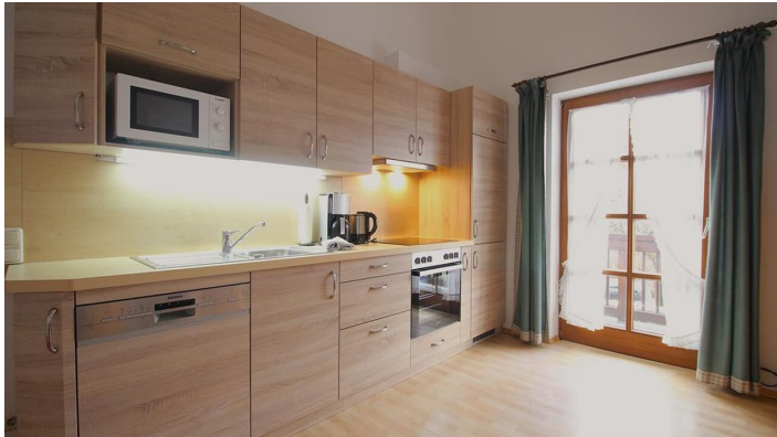
MARTIN Küche