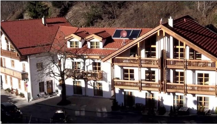
Bildschirmfoto 2018-01-10 um 08.53.49