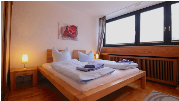
WETTERSTEINBLICK SZ