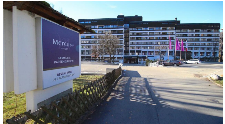
WETTERSTEINBLICK Zufahrt