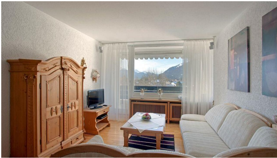
WETTERSTEINBLICK Ansicht