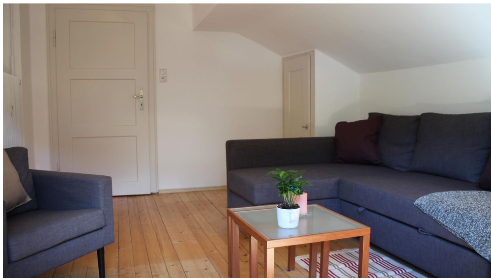
Wohnzimmer mit Schlafsofa