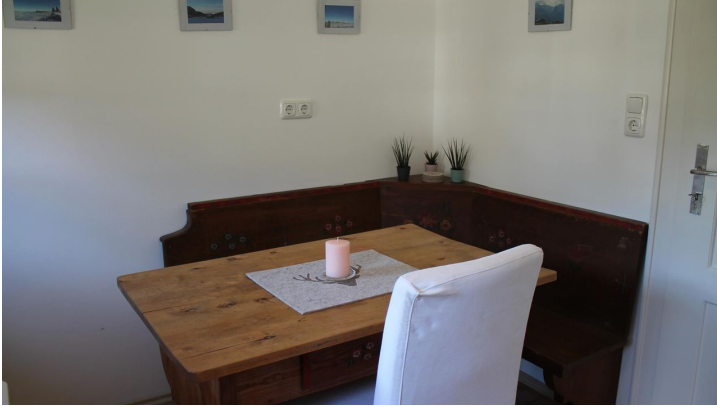
Essplatz in Küche