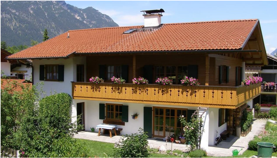
Ferienwohnungen Stephanie Hördegen