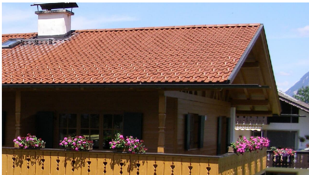
FeWo Osterfelder - © Stephanie Hördegen