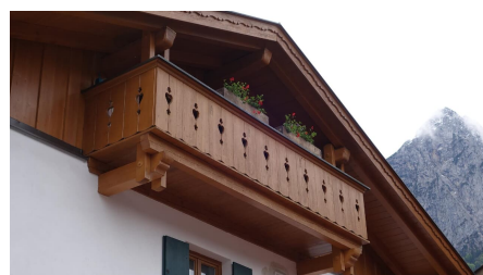
FeWo Kramer