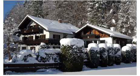
Winteransicht Seite 2