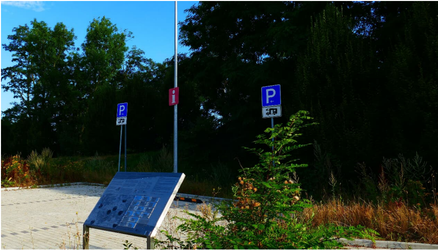
Wohnmobilstellplatz in Heiligenhaus