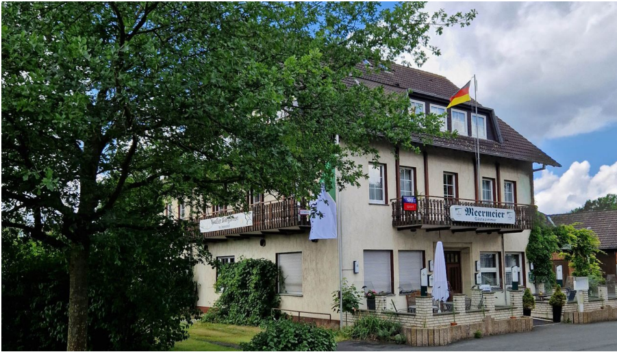
Hotel-Restaurant Meermeier | Paderborner-Sande - - info@paderborner-land.de