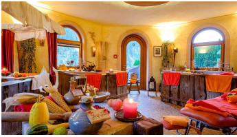
Wellnesshotel Tanne Mönchstube