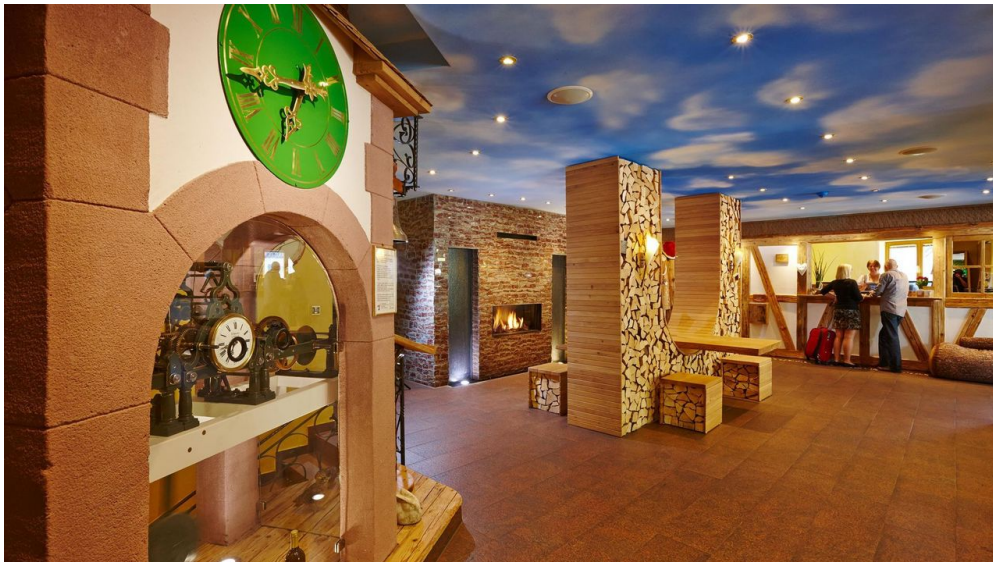
Wellnesshotel Tanne Halle