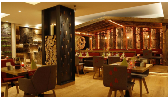
Wellnesshotel Tanne Nationalparkstube