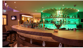
Wellnesshotel Tanne Baumbar