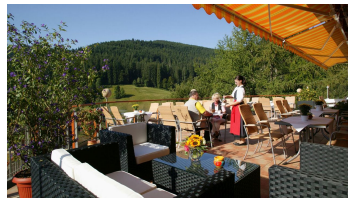
Wellnesshotel Tanne Terrasse