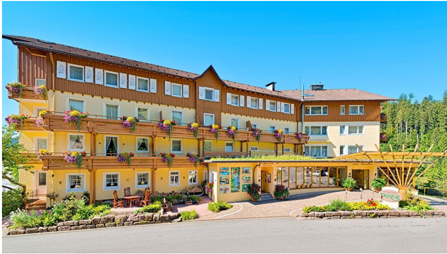
Wellnesshotel Tanne Außenansicht