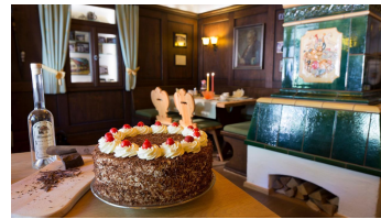
Wellnesshotel Tanne Schwarzwälder