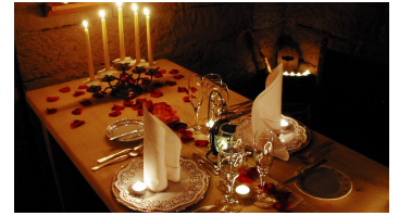
Wellnesshotel Tanne Kuschelkeller