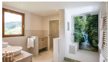
Wellnesshotel Tanne Himmelssuite Badezimmer