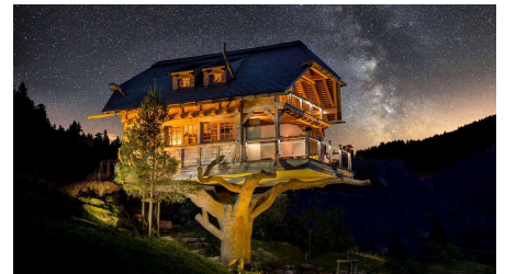
Wellnesshotel Tanne Baumhaus-Sauna