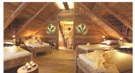
Wellnesshotel Tanne Baumhaussauna Ruheraum