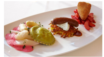
Wellnesshotel Tanne Speise