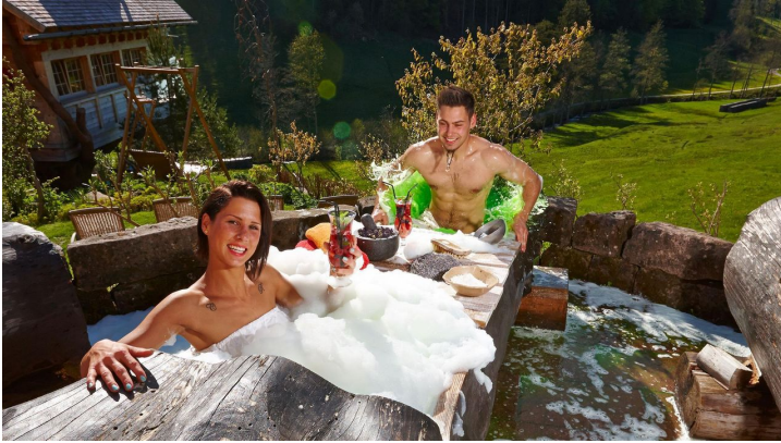
Wellnesshotel Tanne Baumstammbad