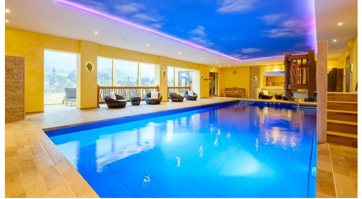
Wellnesshotel Tanne Schwimmbad