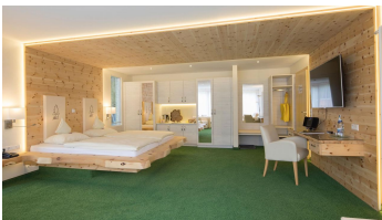
Wellnesshotel Tanne Himmelssuite