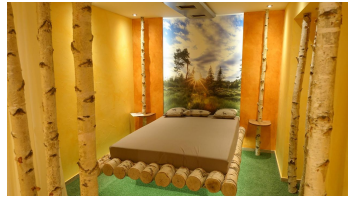
Wellnesshotel Tanne Sonnenwiese