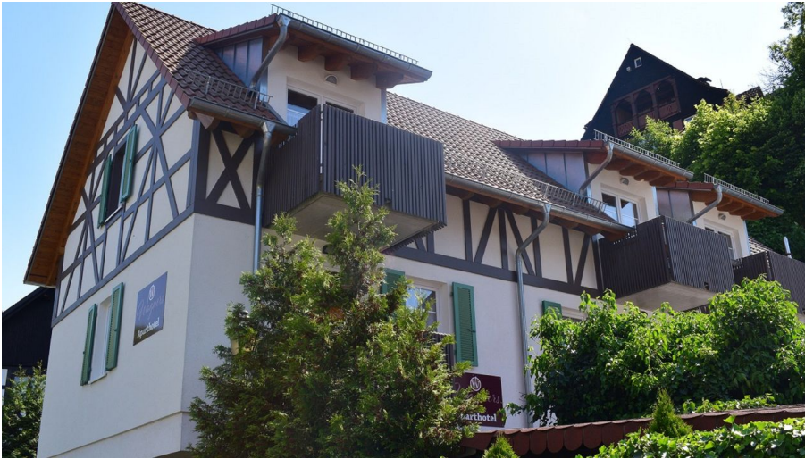
Wagners Aparthotel Sasbachwalden