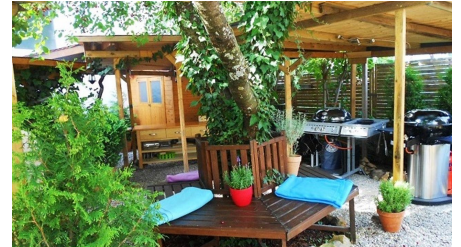
BBQ im Garten