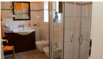
Wagners Aparthotel Badezimmer - © Anita Wagner