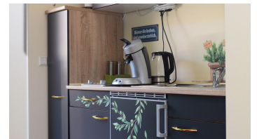
Wagners Aparthotel Hotelzimmer