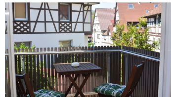
Wagners Aparthotel Sasbachwalden