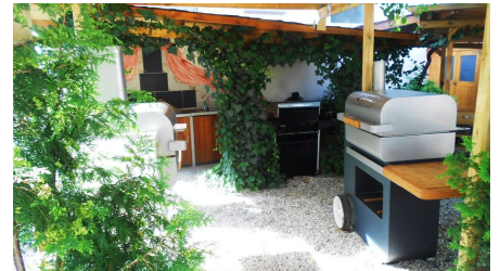
BBQ im Garten