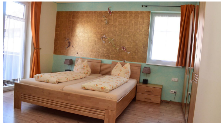
Wagners Aparthotel Sasbachwalden