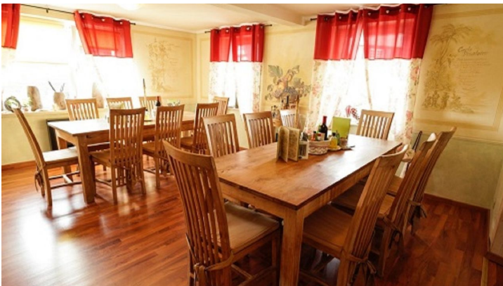
Kochschule Wagner