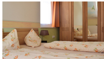
Wagners Aparthotel Sasbachwalden Zimmer