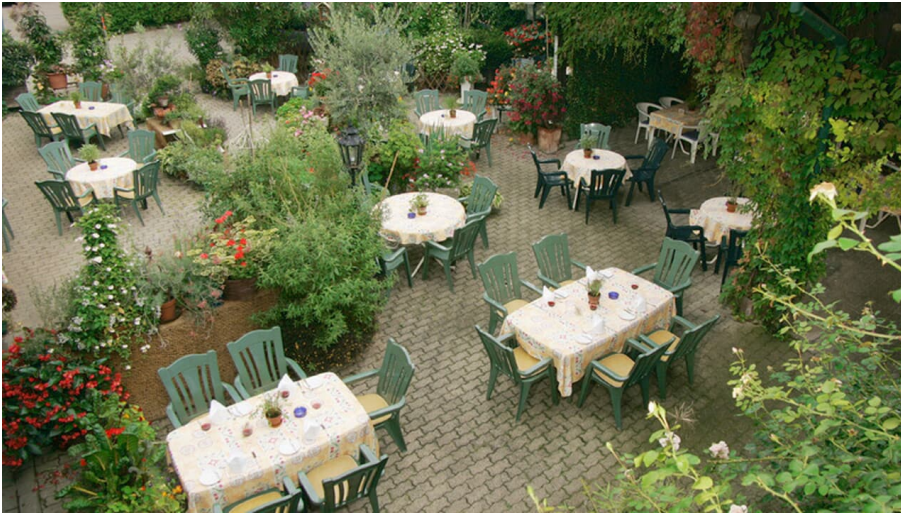
Landgasthof Kininger´s Hirsch Außenansicht