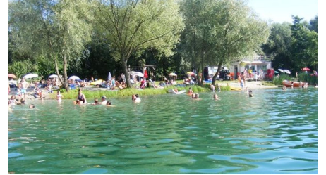
Campingplatz Achersee See