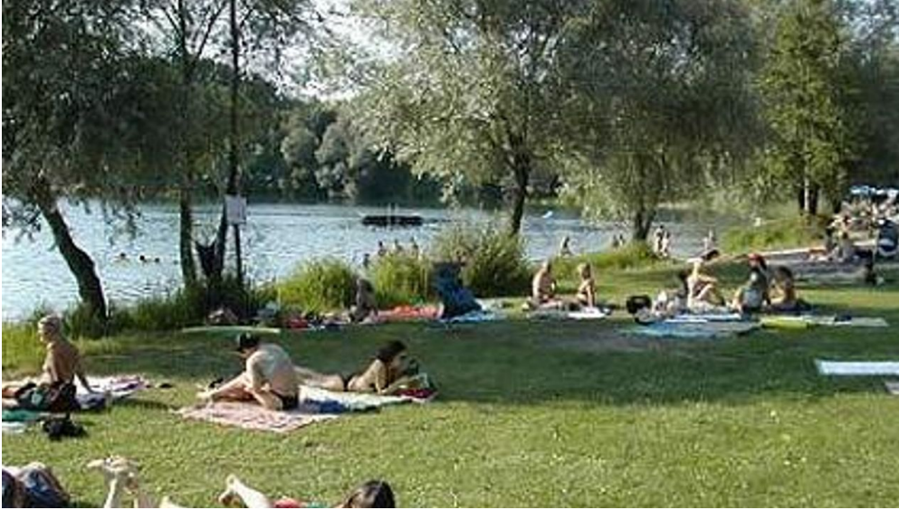
Campingplatz Achersee Liegewiese

ID: h_54115 Zuletzt geändert am 10.06.2024, 12:20