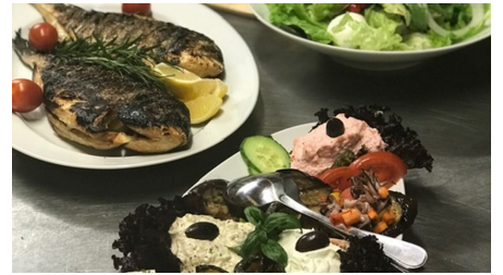
Campingplatz Achersee Restaurant