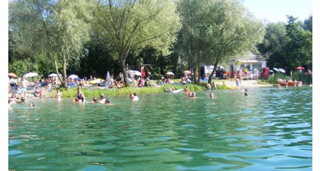
Campingplatz Achersee See