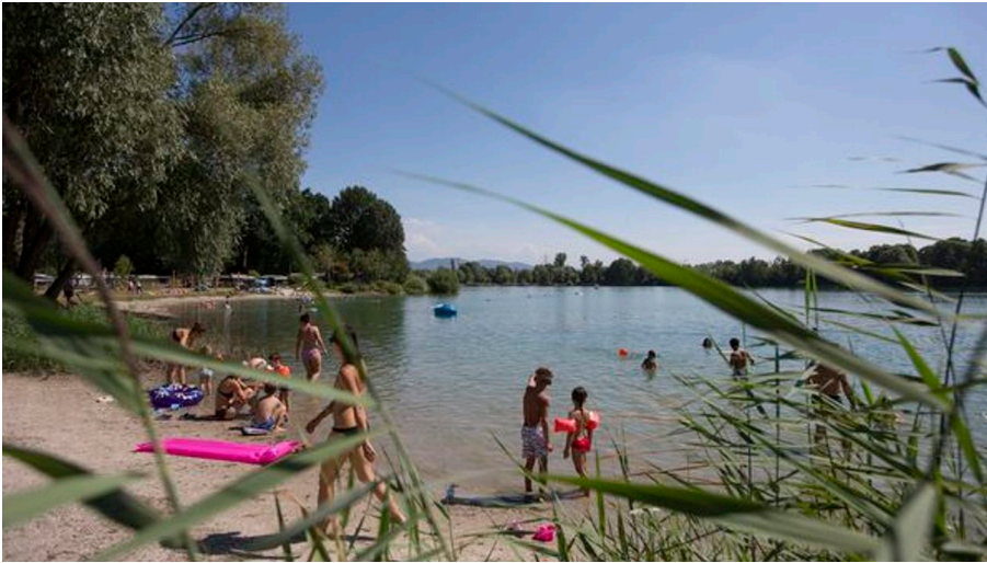
Campingplatz Achernsee Strand