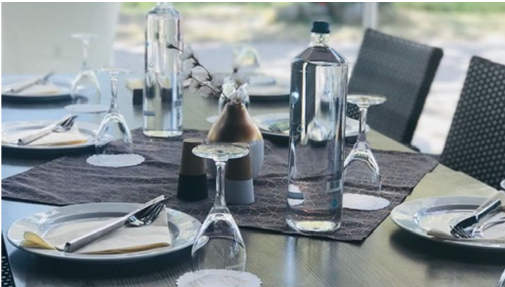
Campingplatz Achersee Restaurant2 - © tomas