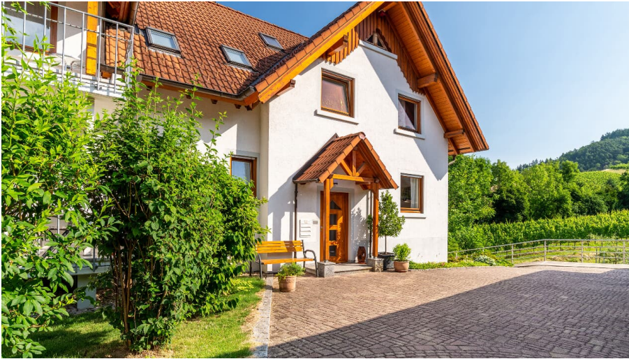
OUTSIDE, INSIDE