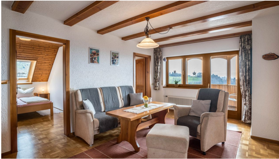
OUTSIDE, Photo, INSIDE